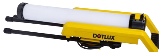
Praktische Kabelaufhängung auf der Rückseite