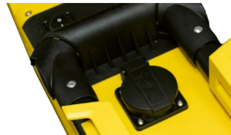
Schalter und Schuko-Steckdose auf der Rückseite mit IP 54 Schutz