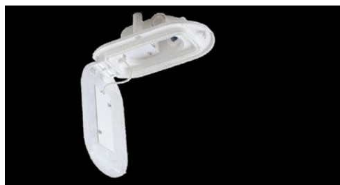
Einfache und schnelle Montage