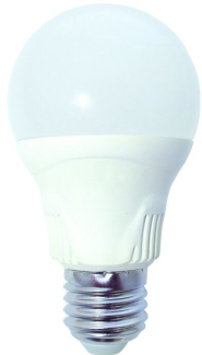
E27 Birne mit stimmungsvollem Licht 2700 K